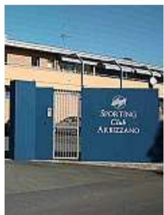
Lo Sporting di Arbizzano

Per raccogliere i fondi necessari per coprire le spese del progetto "Nuoto per tutti e tutti per il nuoto" (corsi di nuoto gratuiti per ragazzi disabili) l'Associazione sportiva Sporting Club Arbizzano e la ProLoco del Comune di Negrar hanno ideato una bellissima giornata sportiva, la "Maratona di nuoto", con l'obiettivo di riuscire a sopprimere ogni costo in modo tale che anche i disabili possano avvicinarsi al mondo acquatico. Il corso viene promosso per una durata annuale e vedrà la presenza di